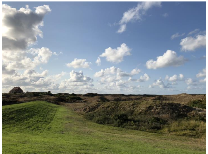
Dünenlandschaft auf Spiekeroog

In der geplanten Exkursion sollen Einblicke in die Insel, die Schule, die Menschen und das Land gewonnen werden. Dabei wird im Zentrum die Frage stehen, wie prägt die Landschaft die Erziehung und den Unterricht von Kindern und Jugendlichen, wo sind die Chancen zu sehen und wo die Gefahren. Um dies herauszufinden, sind Gespräche mit Lernenden, Lehrpersonen und der Schulleitung vorgesehen, ebenso wie Naturerkundungsgänge über die Insel, z. T. geführt durch erfahrene und überzeugte Insulaner. Zudem sind Kooperationen mit den dortigen Bildungseinrichtungen geplant. Darüber hinaus werden auch Aspekte der Umweltbildung und von Nachhaltigkeit thematisiert. Inwiefern spielen diese Faktoren