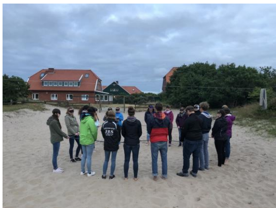
Lernen in der Natur

Eine Exkursion nach Spiekeroog nutzt in besonderer Art und Weise die Möglichkeiten außeruniversitärer Lernorte sowie die Expertisen auf Spiekeroog und trägt damit zu einer wesentlichen Verbesserung der Qualität der Lehre bei.