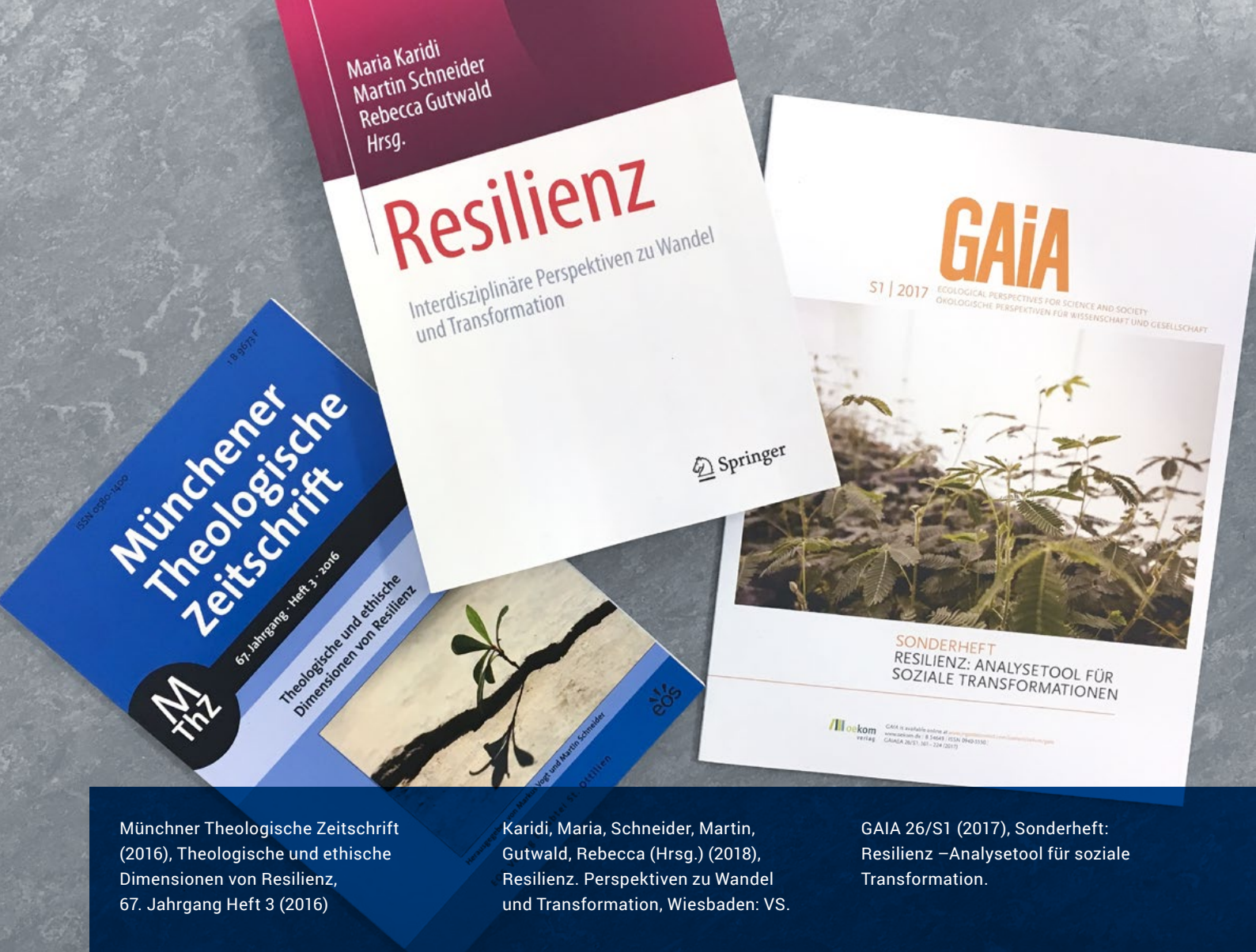
Münchener Theologische Zeitschrift (2016), Theologische und ethische Dimensionen von Resilienz, 67. Jahrgang Heft 3 (2016)